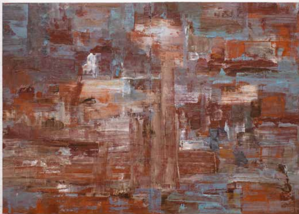
Scratch n.22 , 2018, olio su carta, cm 25,5 x 35,5