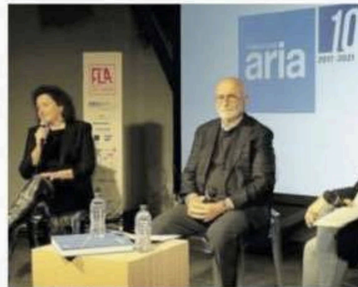
Celebrati i dieci anni della Fondazione Aria

spiega che «circa 100 soci iniziarono a collaborare con noi, e da appena due anni anche la regione Abruzzo ha riconosciuto il valore delle operazioni di Fondazione Aria». Operazioni che da dieci anni appena compiuti perseverano nel valorizzare artisti del nostro territorio e non, con incroci e scambi costruiti con pazienza anche in ambito internazionale, materia di cui si occupa soprattutto l'evento "Stills of peace", costola della Fondazione con lo scopo di mettere in dialogo l'Abruzzo con le altre nazioni del mondo al fine di realizzare eventi dove l'arte, nei suoi vari linguaggi, è protagonista, un terreno dove potersi incontrare e conoscersi nel rispetto delle culture stesse. Ma tornando ai primordi, il primo evento che nel 2012 animò piazza della Rina-