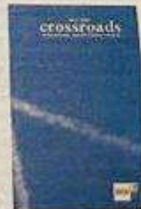
La copertina del volume "Crossroads, Crocevia di artisti e culture" (Dello Iacono Editore)